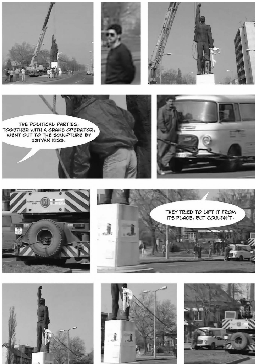
1. Kiss István debreceni Tanácsköztársaság-émlékművének ledöntése, 1990. március 20. Little Warsaw: Rebels . Budapest: tranzit.hu-Kassák Lajos Alapítvány, 2017. 30. A művészek jóvoltából © Kis Varsó © HUNGART 2020