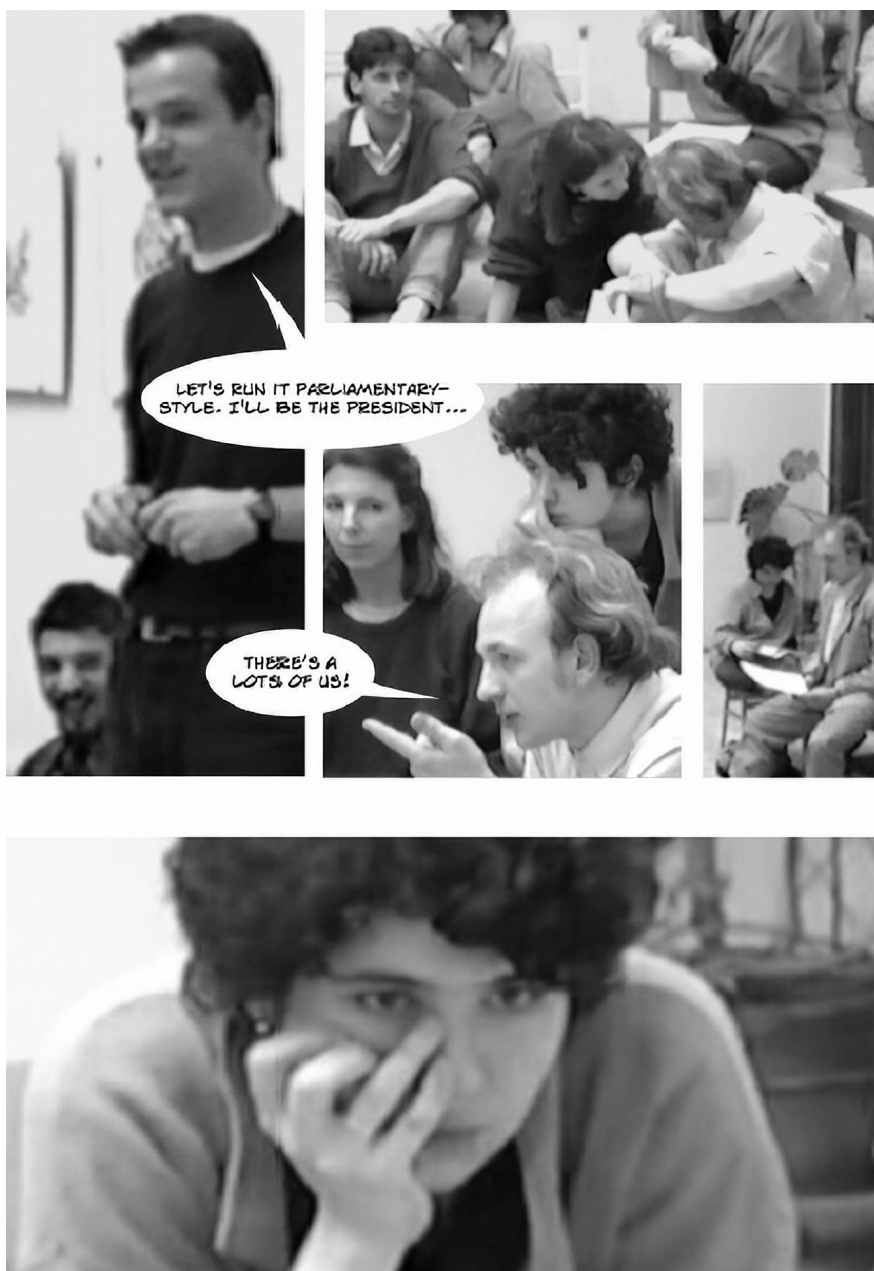
4. A Magyar Képzőművészeti Főiskola első nagy diákfóruma, 1990. március 1. Little Warsaw: Rebels . Budapest: tranzit.hu-Kassák Lajos Alapítvány, 2017. 64. A művészek jóvoltából © Kis Varsó © HUNGART 2020