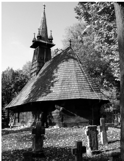
2. A türei görög katolikus fatemplom a bukaresti Dimitrie Gusti Nemzeti Falumúzeumban, 1970 körül

Tehát amikor tudva jogtalanságot, illetőleg éppen sikkasztást követnek el, ugyanakkor azt ellenséges szándékból, nemzetünk iránti gyűlöletből is teszik. Sőt azzal a szándékkal, hogy egykor ez a kezükre játszott emlék hamis tanúságot tegyen nemzetünk, népünk művésze ellen.