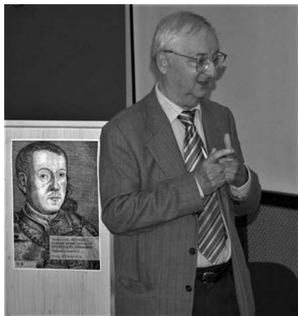
Előadás közben a kőszegi Esterházy Pál-konferencián, 2013. május 22–23.